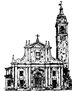
PARROCCHIA PREPOSITURALE SAN ZENONE Castano Primo