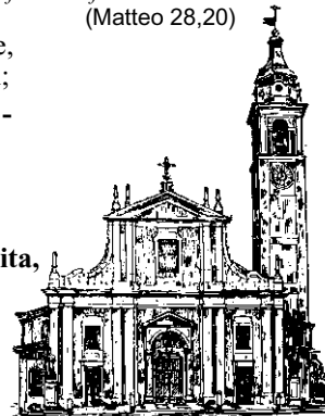
PARROCCHIA PREPOSITURALE SAN ZENONE Castano Primo

- E insieme a te, con la mia vita, al mio fratello risponderò.